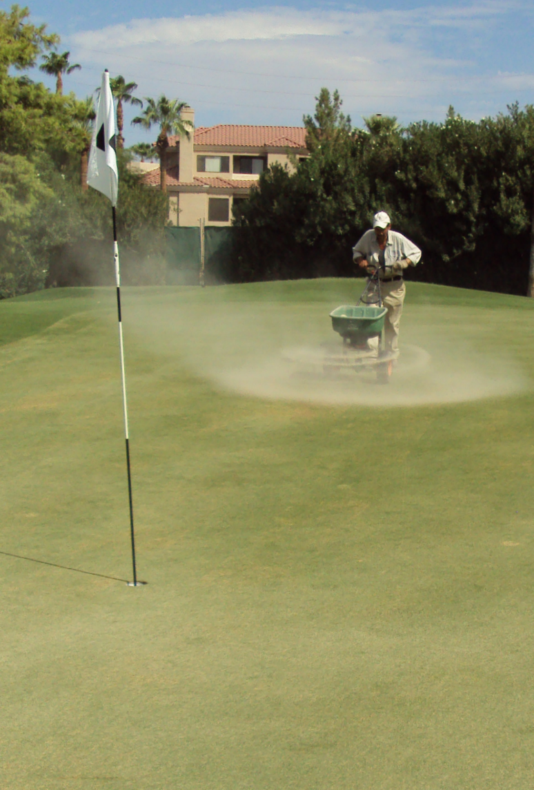
Lette mængder topdressing på 2,7-4,2 tons sand per hektar anvendes i perioder med minimal vækst.

Trends observeret af USGA's agronomer tyder på, at 102,6 til 135 tons sand pr. hektar om året er et godt årligt mål for at opnå en tilstrækkelig fortyndelse af det organisk materiale. Afhængigt af de andre faktorer, der er beskrevet nedenfor, kan mere eller mindre end dette interval være passende.