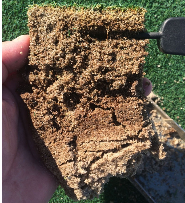
To vækstsæsoner efter at have påbegyndt et topdressingprogram, hvor der blev brugt mindst 122,9 tons per hektar årligt, er mængden af organisk materiale faldet med 30 %, og overfladens kvalitet er forbedret betydeligt.