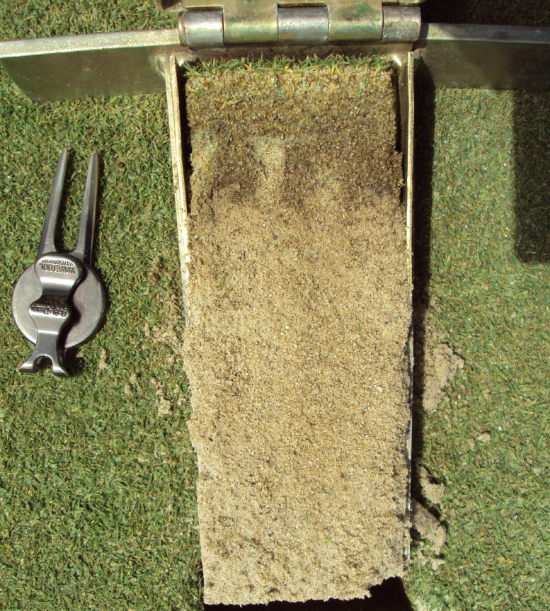
Disse krybende hvene greens blev prop-luftet to gange om året, men blev relativt sjældent topdresset. Ophobningen af organisk materiale forårsagede bløde greens og lokale tørkepletter